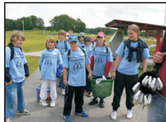
Förväntansfulla ungdomar laddar upp inför aktiviteterna under Fritidslägret.